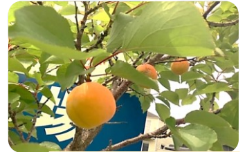
↑あんずの木に、実が なりました(5月下旬)

病児保育室あんずがある牛浜交差点周辺はとても自然豊かです。近くに玉川上水や段丘崖の緑地があり、様々な生き物と出会えます。クリニック駐車場にはサワガニもいましたし、ウグイスやカワセミ、コゲラなど様々な鳥たちの声も沢山聞こえてきます。保育中、おもちゃで夢中になって遊んでいる子ども達も♪ホーホケキョウ♪と鳴く声に「何の音？」と窓の外を指さし、「また聞こえるかな」と期待しながらじっと待ちます。そんな子どもの姿を見ていると、豊かな自然に感謝の気持ちでいっぱいになります。